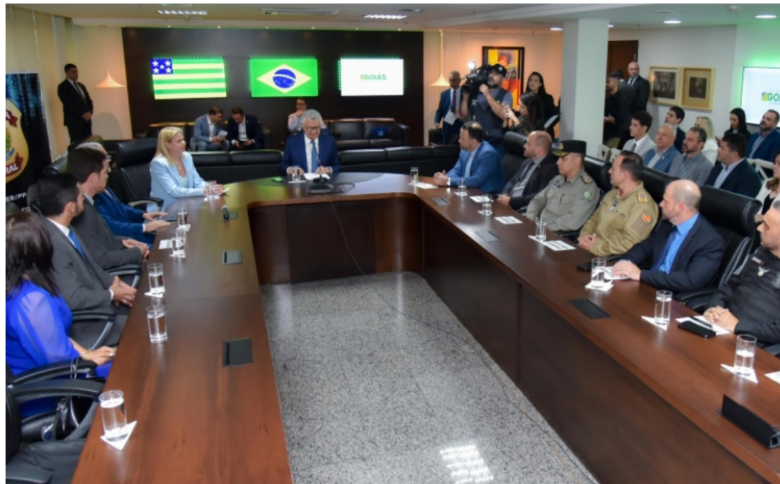
Ronaldo Caiado assina acordo com PF para troca de informações: foco no combate à lavagem de dinheiro e pedofilia