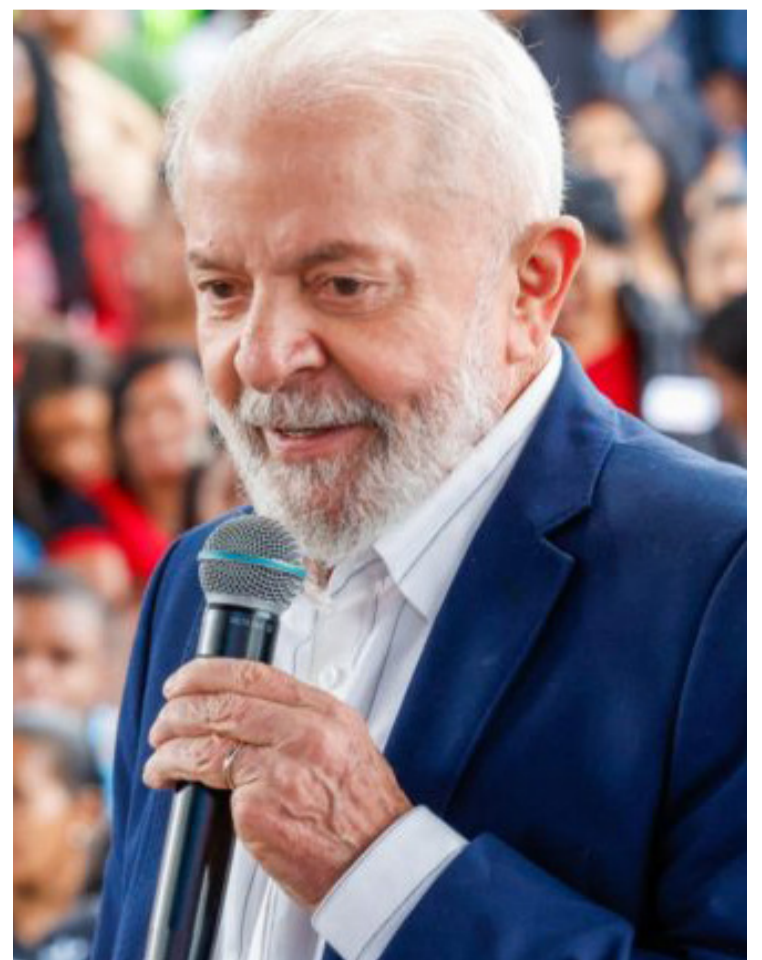
Lula da Silva: dificuldades em reduzir gastos públicos

“Começamos aqui a discutir 2025, a agenda de gastos. O que a gente pediu foi uma intensificação dos trabalhos”, afirmou Haddad há pouco mais de três semanas. “Nós temos um dever de casa agora sobre o lado das despesas.”