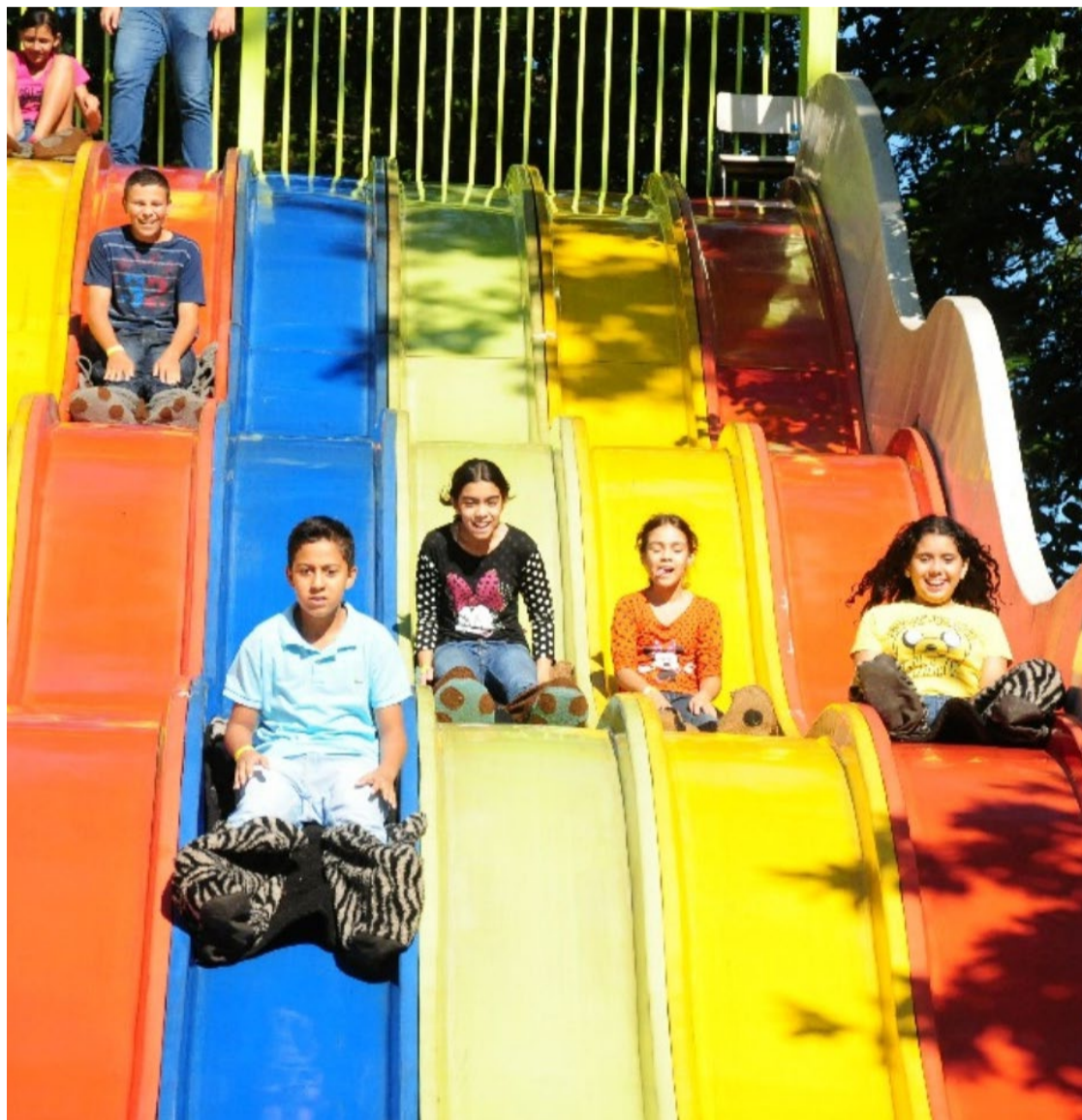
Crianças se divertem no parque Mutirama: uma das melhores alternativas de férias na Capital

Julho é sinônimo de criança em casa e cheia de energia. DM traz roteiro com opções da Capital e também como se divertir em casa