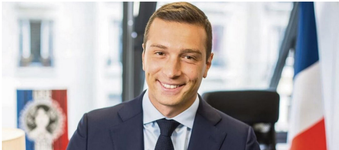
Jordan Bardella, 28, desponta como jovem líder da extrema-direita francesa

A vitória potencial do RN nas eleições legislativas france-