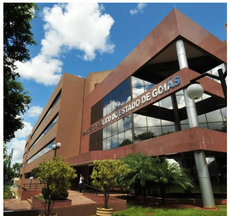
Uma escola particular de Rio Verde deverá pagar multa por cobrar taxa extra para atendimento de estudantes da educação especial — Foto: Reprodução.

Na decisão, a juíza Renata Facchini Miozzo observou que, embora a escola tenha corrigido a cláusula contratual, essa correção foi insuficiente e tardia, demonstrando má-fé da instituição.