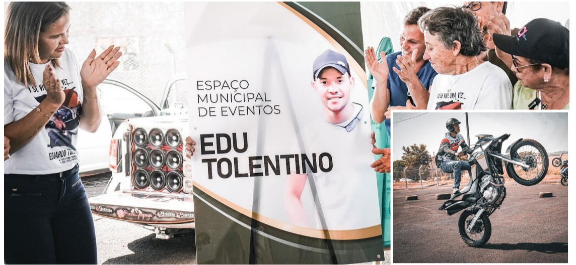
Espaço de eventos e som automotivo inaugurado no último domingo, data em que seria o aniversário do homenageado