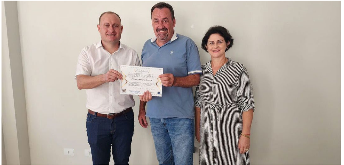
Gestores da educação foram diplomados e assinaram o termo de compromisso de gestão — Foto: Reprodução.

Os gestores foram diplomados e assinaram o termo de compromisso de gestão, fortalecendo a democracia e equidade na educação de São Simão e Itaguaçu.