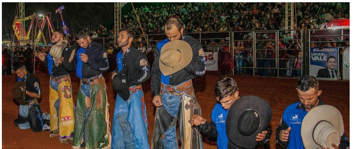
Momentos da 43ª ExpoMineiros, que agitou a cidade no final de semana — Foto: Reprodução.

valorizem a tradição rural e ressaltou o papel dos agricultores e pecuaristas como impulsores do crescimento.