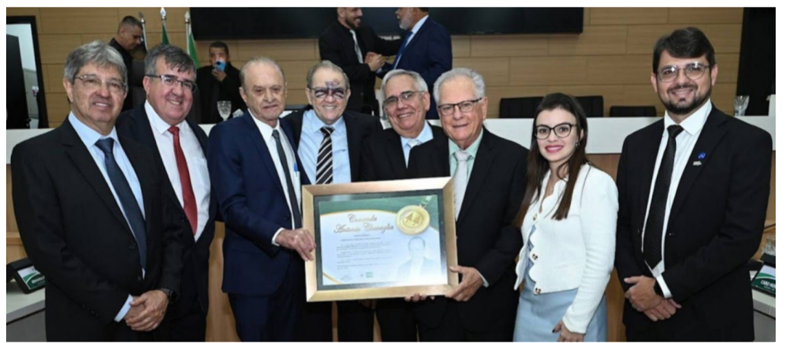
Sessão solene foi realizada na noite desta sexta-feira (28)

Durante seu discurso, o homenageado lembrou dos companheiros pioneiros na inauguração da Comigo, do apoio da esposa e dos filhos e agradeceu o vereador Gerlos pela proposta de criar a comenda e os amigos presentes das empresas cooperadas. “Tive o apoio da família durante minhas viagens por vários anos no meu trabalho enquanto líder cooperativista. Digo que a Comigo está acima dessa comenda, ninguém faz nada sozinho e sem a ajuda dos