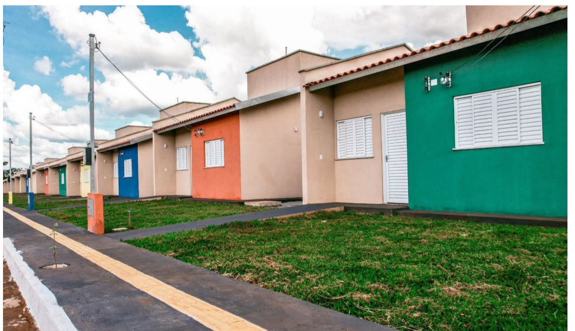
Mineiros entrega mais 50 unidades habitacionais do Programa Pra Ter Onde Morar - Casas a Custo Zero — Foto: Reprodução.

De acordo com o presidente da Agehab, Alexandre Baldy, o volume do trabalho realizado hoje pela Agência é histórico, já que nunca antes na trajetória das políticas públicas estaduais de habitação foram construídas tantas unidades habitacionais. “O mais significativo é que a gestão Ronaldo Caiado chegou a um número inédito de unidades a custo zero e com qua-